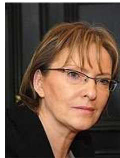
Ewa Kopacz – Minister Zdrowia